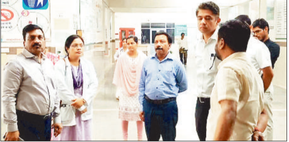
निरीक्षण करते स्वास्थ्य सचिव व अन्य। धन्वन्तरी जेनेरिक दवा दुकानोंसहित पूरे परिसर का