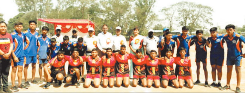
खेलकूद प्रतियोगिता में शामिल अतिथि एवं बच्चे।

देश की सार्वभौमिक एवं सर्वश्रेष्ठ शिक्षण संस्थानों के रूप में अपना लोहा मनवा चुकी केंद्रीय विद्यालय संगठन यू. तो कोई पहचान की मोहताज नहीं है आज भी पूरे भारत और विदेश तक इसकी उपलब्धि और कीर्ति पताका का परचम व्याप्त है। छात्र-छात्राएं यहां से पढ़कर देश-विदेश के विभिन्न महत्वपूर्ण पदों और जिम्मेदारियों पर अपनी सेवाएं दे रहे हैं। शैक्षणिक, प्रशासनिक, राजनीतिक, रक्षा क्षेत्र से लेकर अंतरराष्ट्रीय स्तर तक के खेलकूद में यहां के विद्यार्थियों का वर्चस्व हमेशा से रहा है। केंद्रीय विद्यालय संगठन का मूल मंत्र है विद्यार्थियों का सर्वांगीण विकास अर्थात् विद्यार्थियों को प्रत्येक क्षेत्र में काबिल और परिपक्व बनाना। इस कड़ी में 24 अप्रैल को 54वां संभागीय स्तर के खेलकूद प्रतियोगिता का शुभारंभ हुआ।