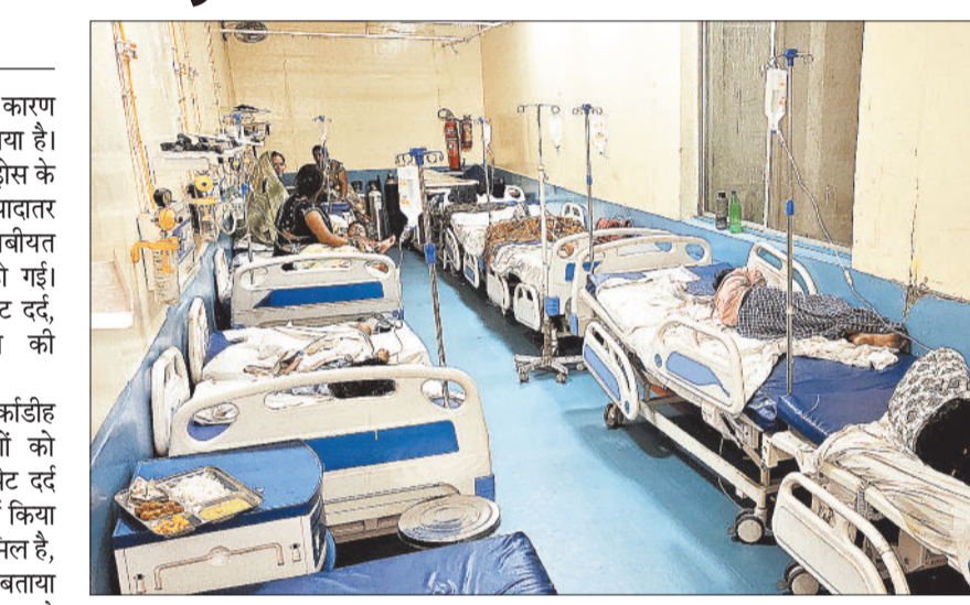
सिम्स में भर्ती फूड पाइजनिंग के मरीजों का चल रहा इलाज।

फूड पाइजनिंग की चपेट में आने के कारण 35 लोगों को सिम्स में भर्ती किया गया है। मामला तुर्कांडीह गांव का है, जहां पड़ोस के गांव में शादी के निमंत्रण में गए ज्यादातर लोगों की तबीयत अचानक खराब हो गई। सभी मरीजों को पेट दर्द, उल्टी और दस्त की शिकायत है। शहर से सटे तुर्कांडीह गांव के 27 लोगों को उल्टी, दस्त और पेट दर्द के बाद इलाज के लिए सिम्स में भर्ती किया गया है। इन मरीजों में 10 बच्चे भी शामिल हैं, जिन्हें उल्टी और दस्त की समस्या है। बताया जा रहा है कि पड़ोस के गांव में एक दिन पहले शादी का निमंत्रण था, ऐसे में पूरा गांव शादी में शामिल होने गया था, इसी शादी का खाना खाने के बाद लोगों की तबीयत बिगड़ी है। गुरुवार की शाम 7 बजे सिम्स के आपातकालीन वार्ड में सभी मरीजों को लाया गया है, उनकी स्थिति को देखते हुए प्रबंधन ने सीधे ट्राइएज में भर्ती कर दिया गया, दो घंटे के अंतराल के बाद कुछ मरीजों की स्थिति में सुधार देखते हुए उन्हें वार्ड में शिफ्ट किया गया है। वहीं 10 बच्चों को पीडियाट्रिक वार्ड में भेजा गया है, बच्चों की उम्र 3 से 15 वर्ष के बीच है। इसमें मरीजों में 1 मरीज की हालत नाजुक है, दिल की धड़कन कम होने के बाद उसे आईसीयू में शिफ्ट किया गया है।