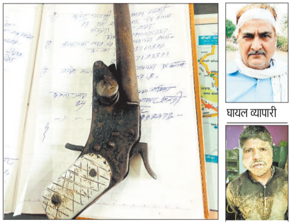
आरोपी से जब्त कट्टा।