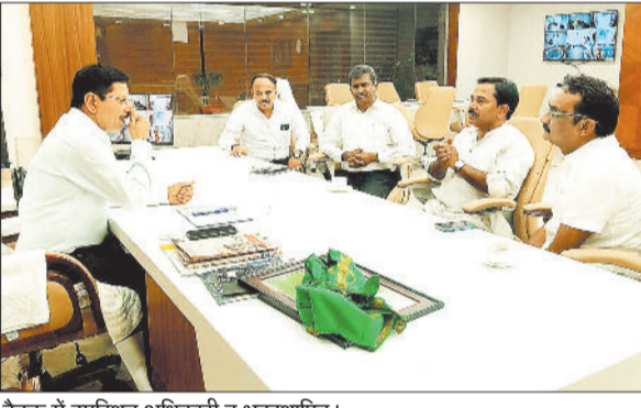
बैठक में उपस्थित अधिकारी व भूवस्थापित।

एसईसीएल बिलासपुर मुख्यालय में बोर्ड मेंबरो व भूविस्थापितों के साथ आयोजित बैठक में भूविस्थापितों की 12 सूत्रीय मांगों को लेकर चर्चा की गई, जिसमें मेगा प्रोजेक्ट के अलावा अब एसईसीएल के अन्य परिया में भी