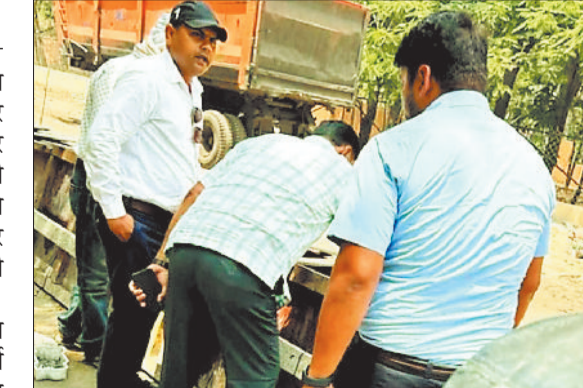
निरीक्षण करते निगम के अधिकारी।

टोपी नगर क्षेत्र में यातायात की समस्या को देखते हुए स्टेडियम से लेकर सीएसईबी चौराहा वाले मुख्य मार्ग पर रोड डिवाइडर की व्यवस्था कराई जा रही है। इसके साथ ही आसपास में सड़क को घेर कर रखे गए कबाड़नुमा वाहनों और अन्य अवरोधक को हटाने की कार्यवाही की जा रही है।